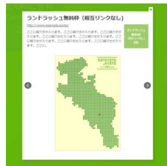
【ポップアップのイメージ】